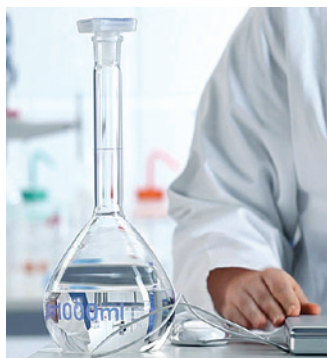
Matraccio tarato non rivestito