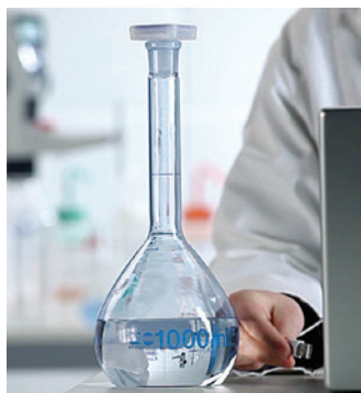
Matraccio tarato con rivestimento in plastica